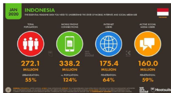
Gambar 1 Pengguna internet di Indonesia tahun 2020

internet dan media sosial untuk memenuhi setiap aktivitas dan kebutuhan pokok, termasuk sandang dan pangan. Media sosial membuat orang puas dengan fasilitas yang melibatkan berbagai konten. Salah satunya adalah media sosial seperti institusi, yang merupakan media komunikasi digital yang cukup mudah diakses. Melalui media sosial Instagram, pengguna dapat mempublikasikan berbagai produk pemasaran media secara online (Aprilya dalam Hildayanti et al, 2020: 69-79).